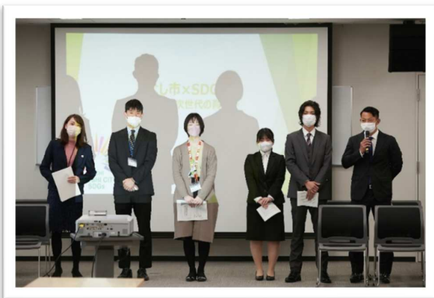
Aグループの発表の様子