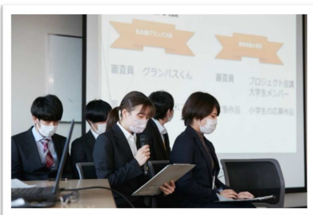
Cグループの発表の様子

プロジェクトに参加した学生たちは、取組みを通じて地域貢献活動のやりがいやSDGsの重要性を実感することができました。さらに、現役の公務員（市職員）のリーダーシップやプレゼンテーションスキルなどを間近でみたり、あるいは指導を受けたりすることによって、社会で活躍するためのノウハウを身に付けると同時に、公務員の仕事やその魅力についても学ぶことができました。